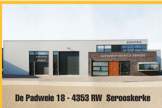
De Padweide 18 - 4353 RW Serooskerke